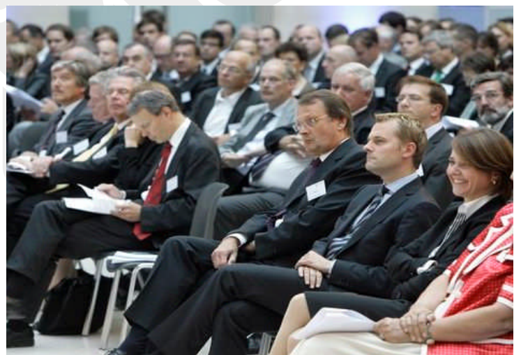
Annette Widmann-Mauz und der Bundesminister für Gesundheit Daniel Bahr