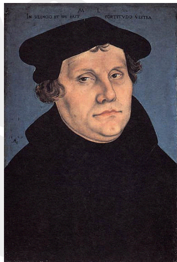
Portrait: Lucas Cranach d.Ä., 1529

als gesellschaftliches, kulturelles und religiöses Ereignis für Deutschland, Europa und die Welt in besonderer Form zu würdigen. Wir werden diskutieren über die christliche Verwurzelung des Abendlandes, über christliche Werte und ihre Beiträge zur sozialen Verantwortung, zur Ausbildung moderner Grundrechte und den Grundlagen der Demokratie sowie ihre Bedeutung über die Landesgrenzen hinaus darstellen.