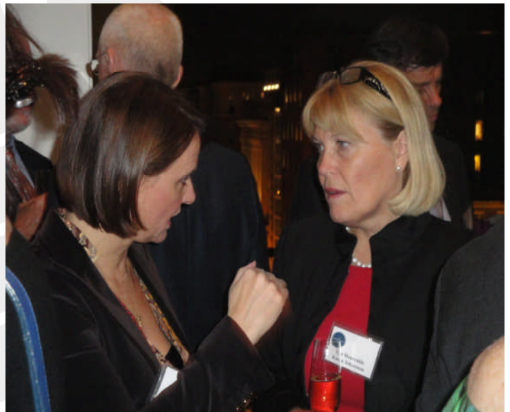
Annette Widmann-Mauz mit Karin Johansson, Staatssekretärin beim schwedischen Minister für Gesundheit und soziale Angelegenheiten

Der Commonwealth Fund ist eine gemeinnützige Stiftung in den USA, die sich die Förderung eines qualitativ hochwertigen Gesundheitssystems zum Ziel gesetzt hat. Sie führt dazu international vergleichende, gesundheitspolitische Studien und Seminare durch und fördert den Dialog zwischen staatlichen Institutionen und sonstigen Akteuren im Gesundheitsbereich.