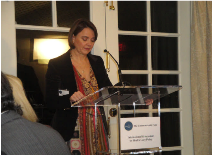
Annette Widmann-Mauz hält die Keynote-Speech zur Eröffnung

In ihrer Eigenschaft als Parlamentarische Staatssekretärin und in Vertretung des Bundesministers für Gesundheit, nahm Annette Widmann-Mauz MdB vom 9.11.2011 – 10.11.2011 am hochrangigen Symposium des Commonwealth Funds zum Thema: „Erreichbarkeit eines gut funktionierenden und zukunftsfähigen Gesundheitssystems: Umkehrung der Kostenkurve“ in Washington D.C. teil.