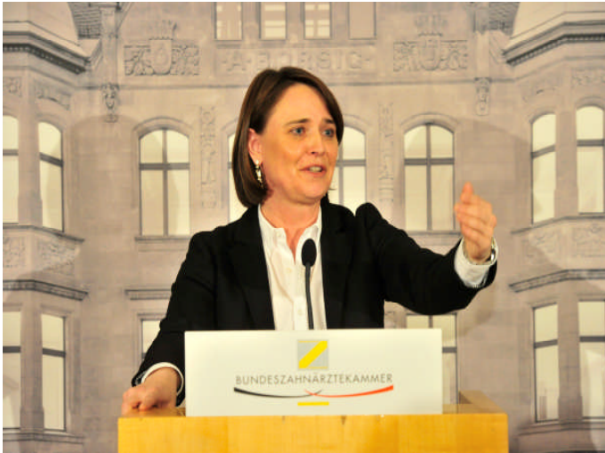
Annette Widmann-Mauz bei ihrem Grußwort anlässlich des Neujahrsempfangs der Bundeszahnärztekammer und der Kassenzahnärztlichen Bundesvereinigung

Diese Woche fand in den Räumen der Parlamentarischen Gesellschaft in Berlin der traditionelle Neujahrsempfang von Bundeszahnärztekammer (BZÄK) und Kassenzahnärztlicher Bundesvereinigung (KZBV) statt. Etwa 460 Gäste aus (Gesundheits-) Politik, Medien und dem zahnärztlichen Berufsstand nutzten die Plattform zum gegenseitigen Meinungsaustausch.